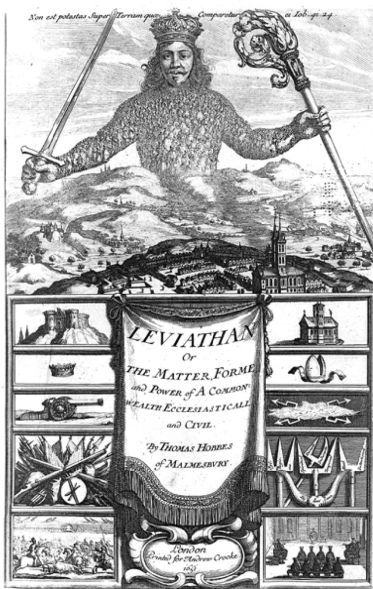
1.3. att. Titullapa no "Leviatāna" (1651. gadā) 4