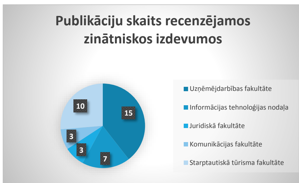
2. att. Publikāciju skaits recenzējamos zinātniskos izdevumos

Lielāko publikāciju daļu sagatavoja Uznēmējdarbības vadības fakultātes docētāji, tas ir 15 publikācijas jeb 40% un Starptautiskā tūrisma fakultātes docētāji – 10 publikācijas jeb 26%, Informācijas tehnoloģijas nodaļas docētāji – 7 publikācijas jeb 18%, Komunikācijas fakultātes docētāji un Juridiskās fakultātes docētāji katrs pa 3 publikācijām jeb 8%.